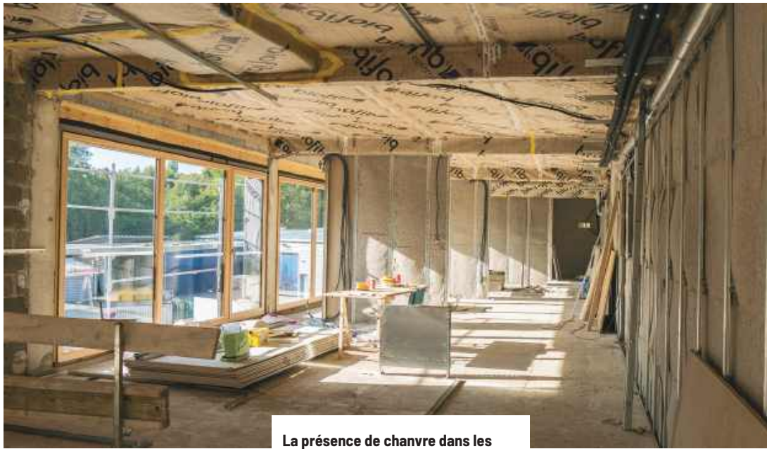
La présence de chanvre dans les cloisons et de dalles de plafond, dont le coefficient d'absorption acoustique est de 1, renforce la qualité acoustique du bâtiment.

«Les vues intérieures ont été soignées, et les espaces de travail végétalisés dont quelques panneaux acoustiques. L'éclairage artificiel est en partie auto-gradable selon la lumière du jour. La qualité sanitaire du bâti a, elle, été étudiée jusqu'aux poignées de porte des sanitaires qui sont bactéricides. Un consultant qualité de l'air et qualité sanitaire a accompagné les entreprises pendant les travaux pour les choix de matériaux sans COV et des systèmes de traitement de l'air. Un monitoring qualité de l'air intérieur a été mis en place pendant deux mois après réception. Le CO 2 et l'hygrométrie dans les locaux font l'objet d'un suivi quotidien avec un affichage pièce par pièce», développe Marc Campesi.